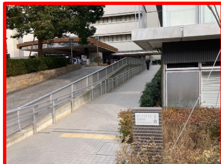
附属病院正面入口